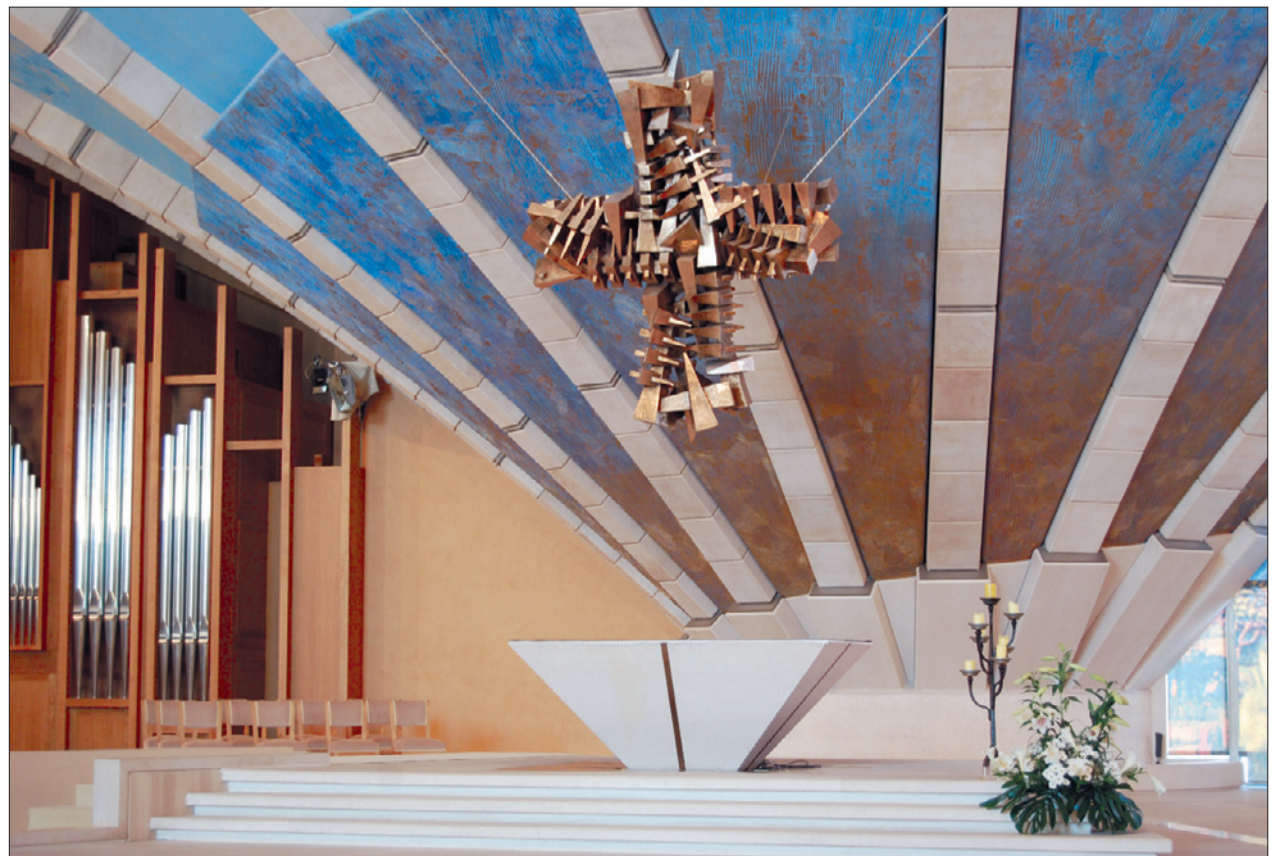
Futuristischer Altar im Mittelpunkt des Dreiviertelkreises, in dem zehn Bögen münden.