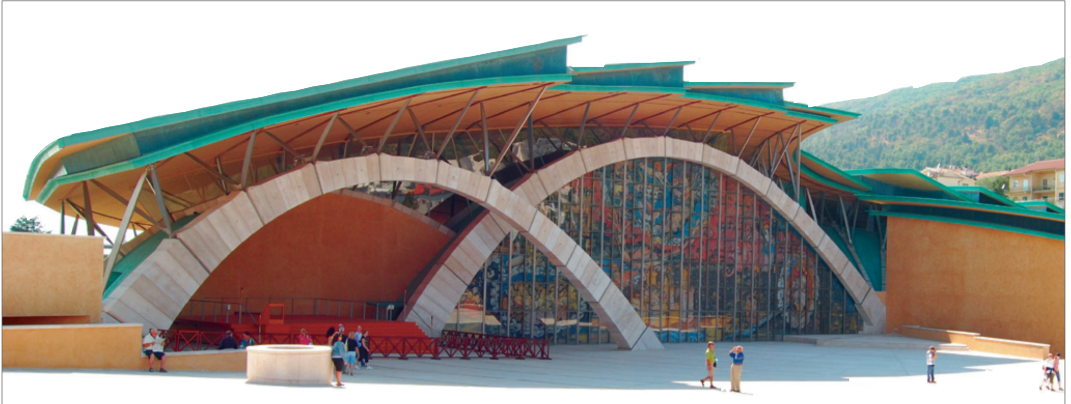
Die „neue“ Kirche in San Giovanni Rotondo, modern, wie eine Muschel entworfen von Renzo Piano. Auf dem große Platz lauschen bis zu 30000 Menschen den Predigten.

Padre Pios neue Kirche in San Giovanni Rotondo – Bauzeit von 1991 bis 2004 – 19500 Quadratmeter Kupfer für Dachhaut – Teil 2