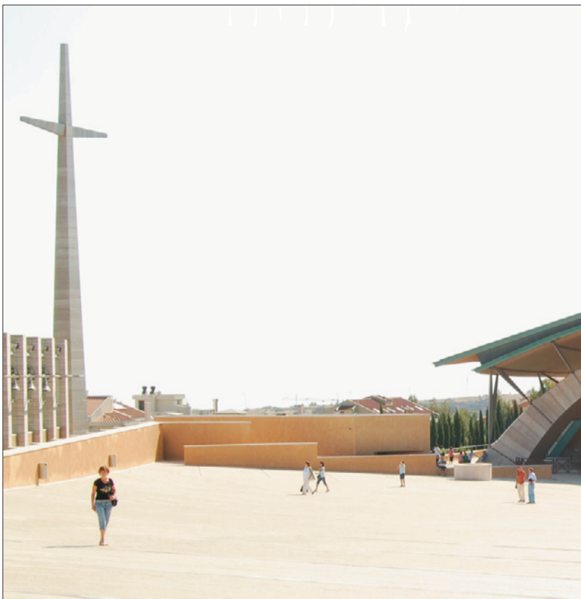
40 Meter hoch ist das Steinkreuz neben dem Eingang zur Kirche.